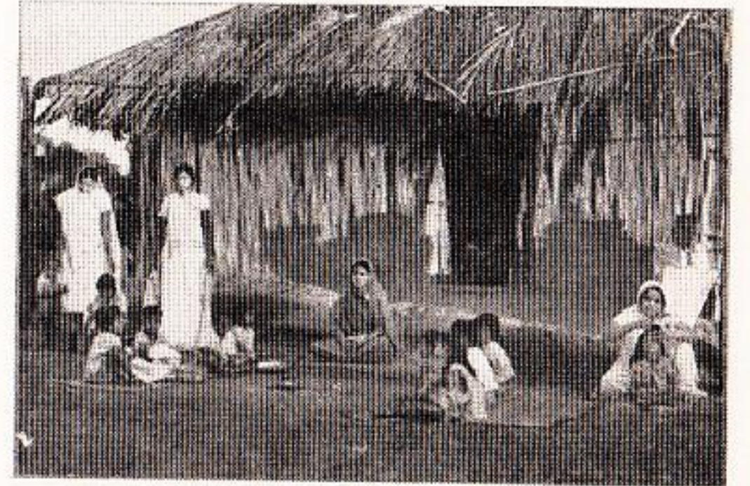
बालकांना शोधीत त्यांच्या घरापर्यंत पोचून त्यांच्या अंगणातच भरणारी अंगणवादी (बोर्नी)